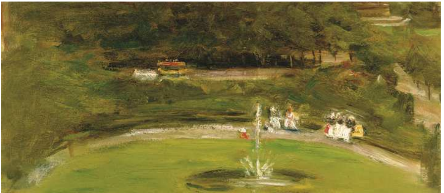
Max Liebermann, Blick aus dem Atelier des Künstlers auf den Königsplatz, 1897 (Ausschnitt)