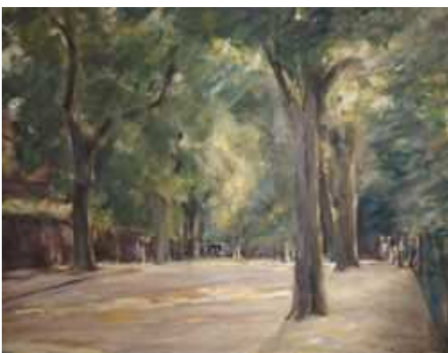
Max Liebermann, Die Große Seestraße, 1923, Foto: Max-Liebermann-Gesellschaft Berlin