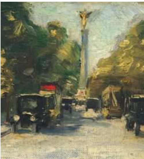
Lesser Ury, Siegesallee mit Siegesäule im Sommer, um 1925 (Ausschnitt)