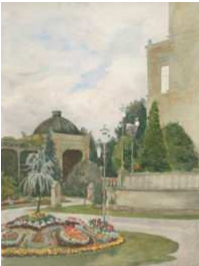
Margarete Krupp, Oberer Terrassengarten, um 1890