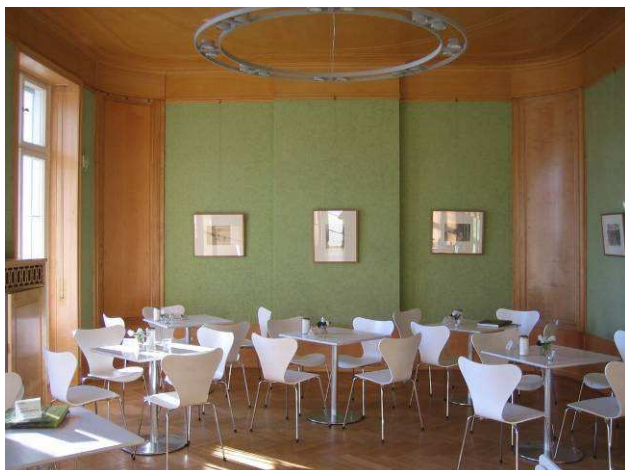
Liebermann-Villa Esszimmer (mit Café-Bestuhlung)

Sie können beim Catering auf das im Haus ansässige „Café Max“ zurückgreifen oder ein Catering-Unternehmen Ihrer Wahl beauftragen. Wir vermitteln Ihnen auf Anfrage auch gern den Kontakt zu Caterern, die schon häufiger in der Liebermann-Villa tätig geworden sind. Wir bitten darum, dass das von Ihnen beauftragte Catering-Unternehmen für eine Ortsbesichtigung mit uns in Kontakt tritt.