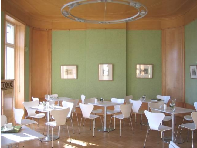
Liebermann-Villa Esszimmer (mit Café-Bestuhlung)