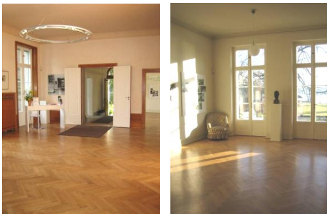
Liebermann-Villa – Kaminzimmer und Salon

Es dürfen keine Veranstaltungen, die dem Zwecke der Max-Liebermann-Gesellschaft Berlin e.V. zuwider laufen, und keine politischen Veranstaltungen durchgeführt werden.